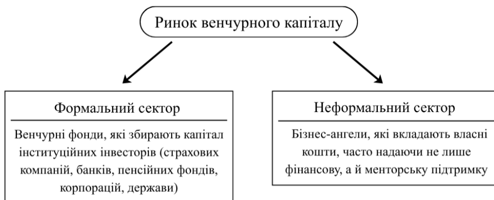
Рис. 1. Структура ринку венчурного капіталу

Людські ризики відрізняються від внутрішніх, хоча часто взаємопов'язані з ними [4]. Зокрема, слабка біз-